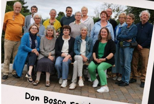
Don Bosco raad