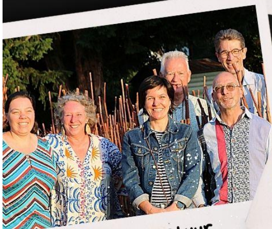
Raad van bestuur